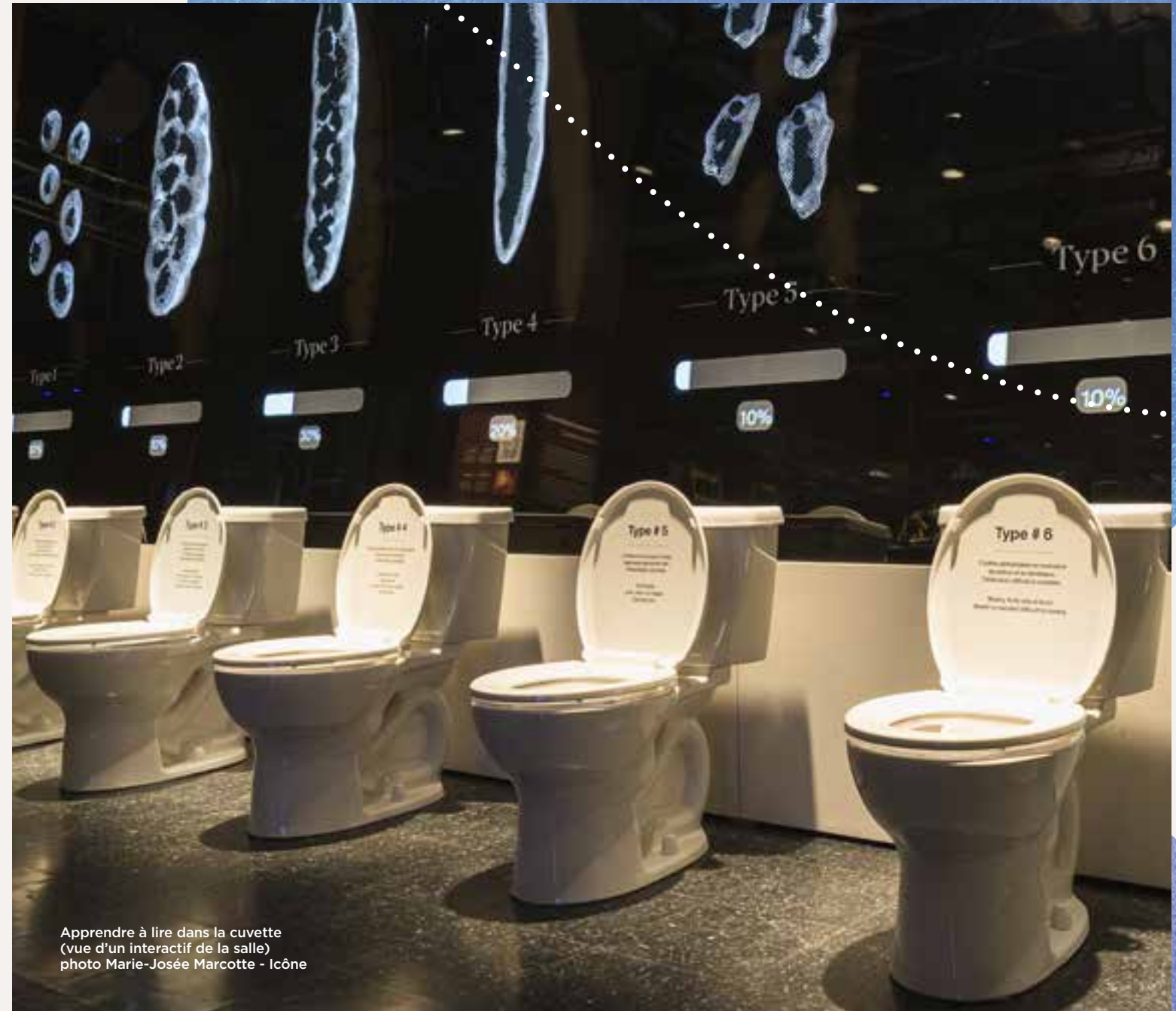
Apprendre à lire dans la cuvette (vue d'un interactif de la salle) photo Marie-Josée Marcotte - Icône

Et pour ceux qui parviennent à surmonter leur gêne? Ils laissent trace de leur passage dans la salle de méditation sur les pets. Avec analyse des gaz incluse. Oui. Trrrés sérieusement.