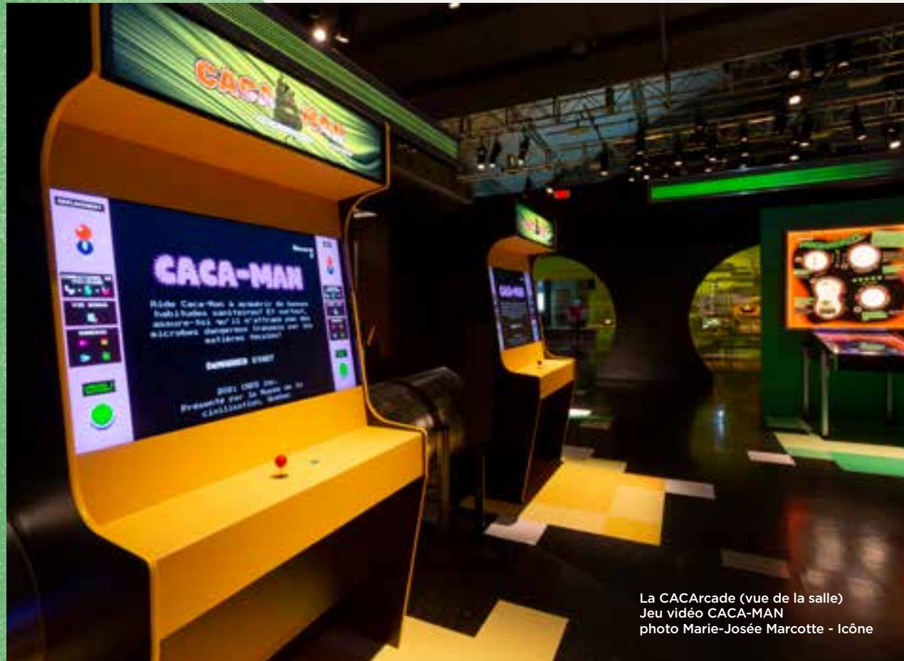
La CACArcade (vue de la salle) Jeu vidéo CACA-MAN photo Marie-Josée Marcotte - Icône