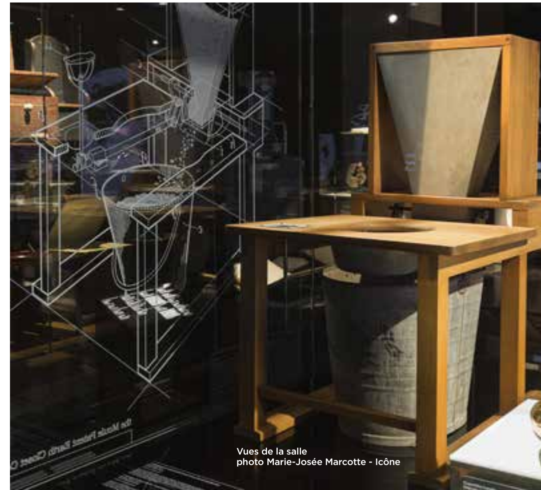
Vues de la salle photo Marie-Josée Marcotte - Icône