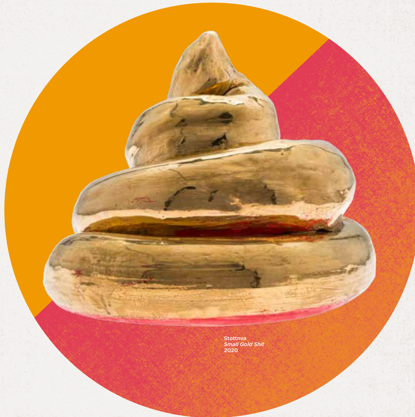
Stottva Small Gold Shit 2020