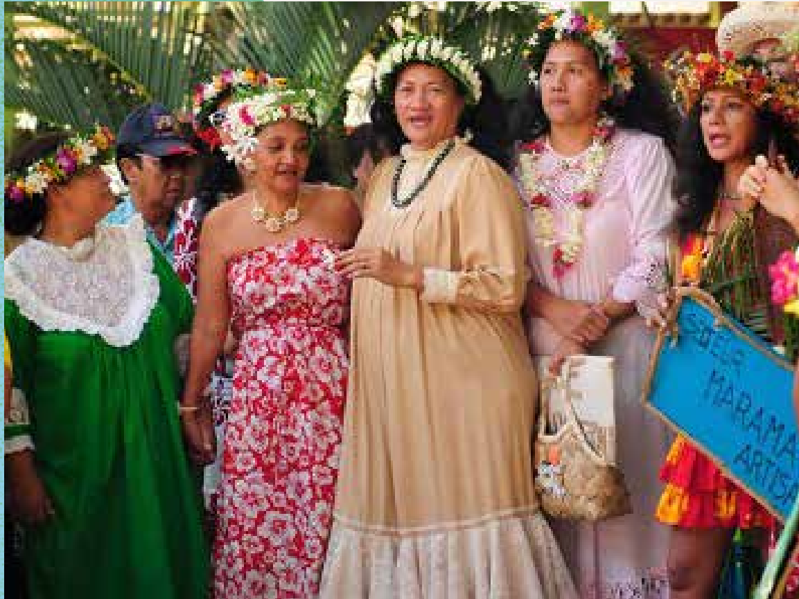
Un groupe de femmes et un mahu (robe crème) participent à un « concours de mission » organisé au marché municipal de Papeete.