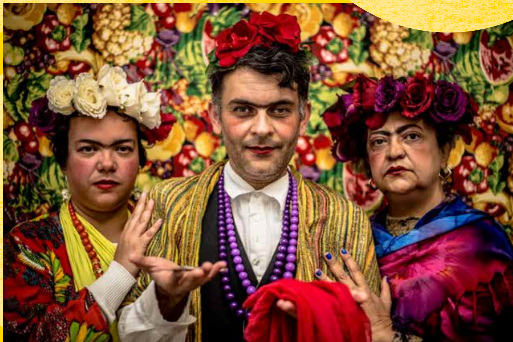
Photo : Musée de la diversité sexuelle, São Paulo, Brésil, exposition We all can be Frida

De la mise en lumière de ce qu'est le genre,