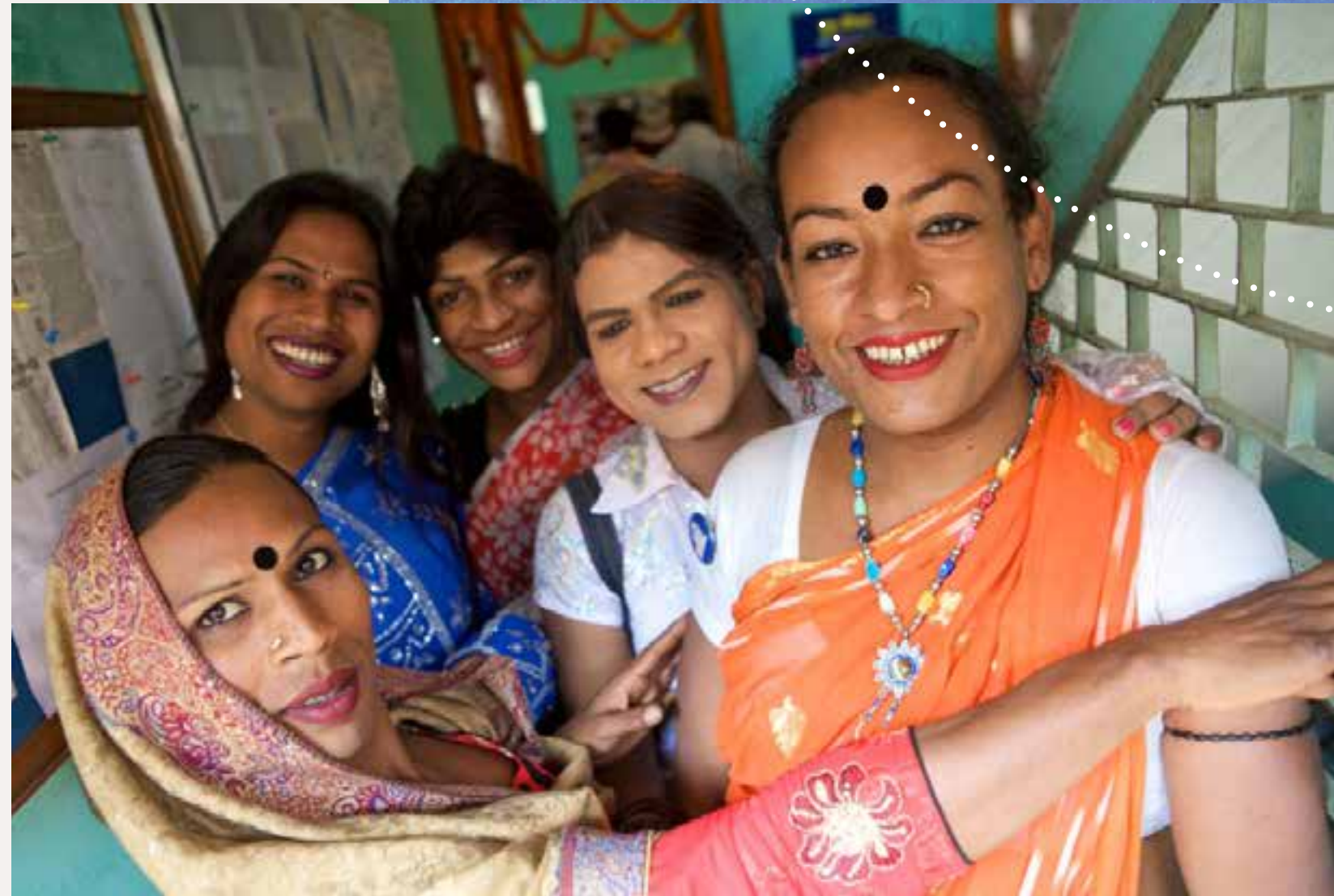
Photo : Un groupe de Hijra, au Bangladesh

À travers l'histoire sociale, la biologie, l'art et de vibrants témoignages, le public sera plongé dans une expérience émotive qui l'amènera à prendre conscience des réalités, des problématiques ainsi que de la pluralité des expériences propres à la diversité des genres. À travers quatre thématiques déployées comme une constellation mettant en lumière cette diversité, le public sera touché par des témoignages et la force évocatrice des objets. Il y verra une invitation à transformer sa perception des réalités relatives au genre et à se positionner comme une personne alliée de la diversité sexuelle et de la pluralité de genres.