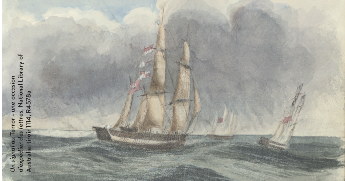
Un signal au Terror - une occasion d'explorer des lettres. National Library of Australia, tiré M4, R4578a