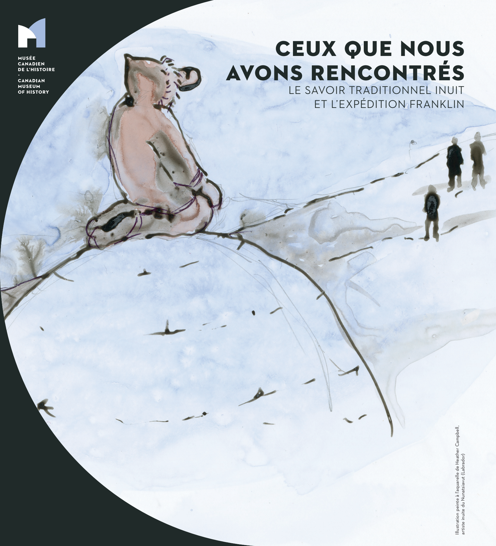
Illustration peinte à l'aquarelle de Heather Campbell, artiste inuite du Nunatsiavut (Labrador)

LE SAVOIR TRADITIONNEL INUIT ET L'EXPÉDITION FRANKLIN