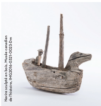
Navire sculpté en bois. Musée canadien de l'histoire, IM62016-0321-0023-Dm