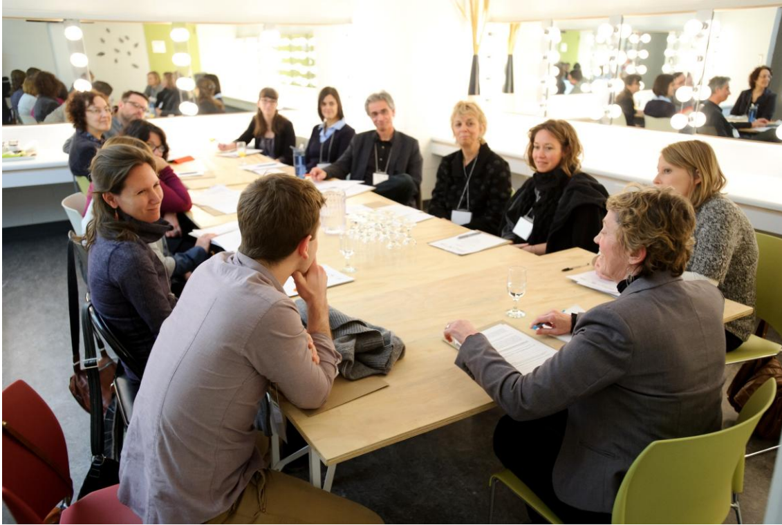
Atelier de réflexion, Maison des arts de Laval.